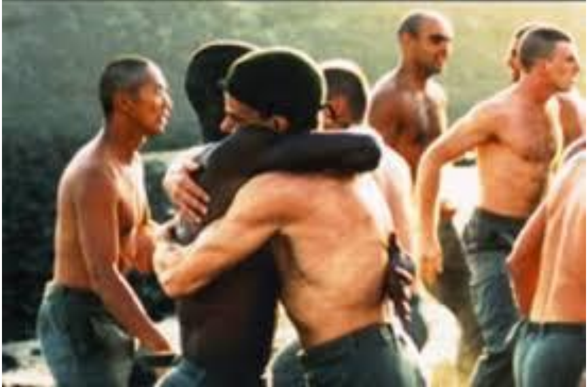
Claire Denis, Beau travail , France, 2000