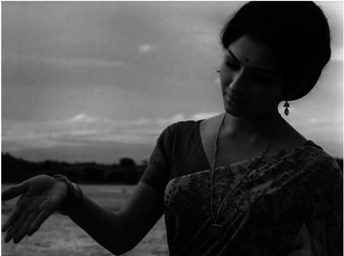
Satyajit Ray, Aranyer Din Ratri ( Des jours et des nuits à travers la forêt ), Inde, 1970

Claire Denis, Nénette et Boni , France, 1996