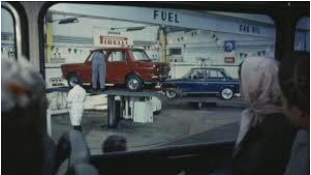
Jacques Tati, Playtime , France, 1967