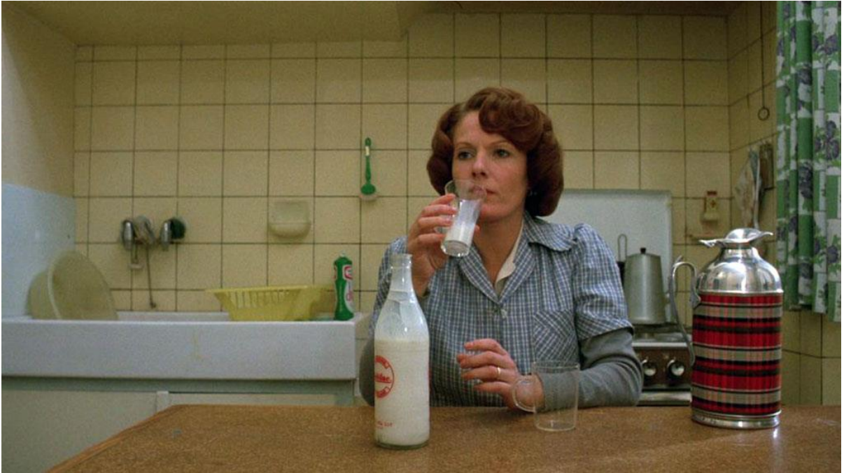
Chantal Akerman, Jeanne Dielman , 23 rue du Commerce, 1080 Bruxelles, Belgique, 1975