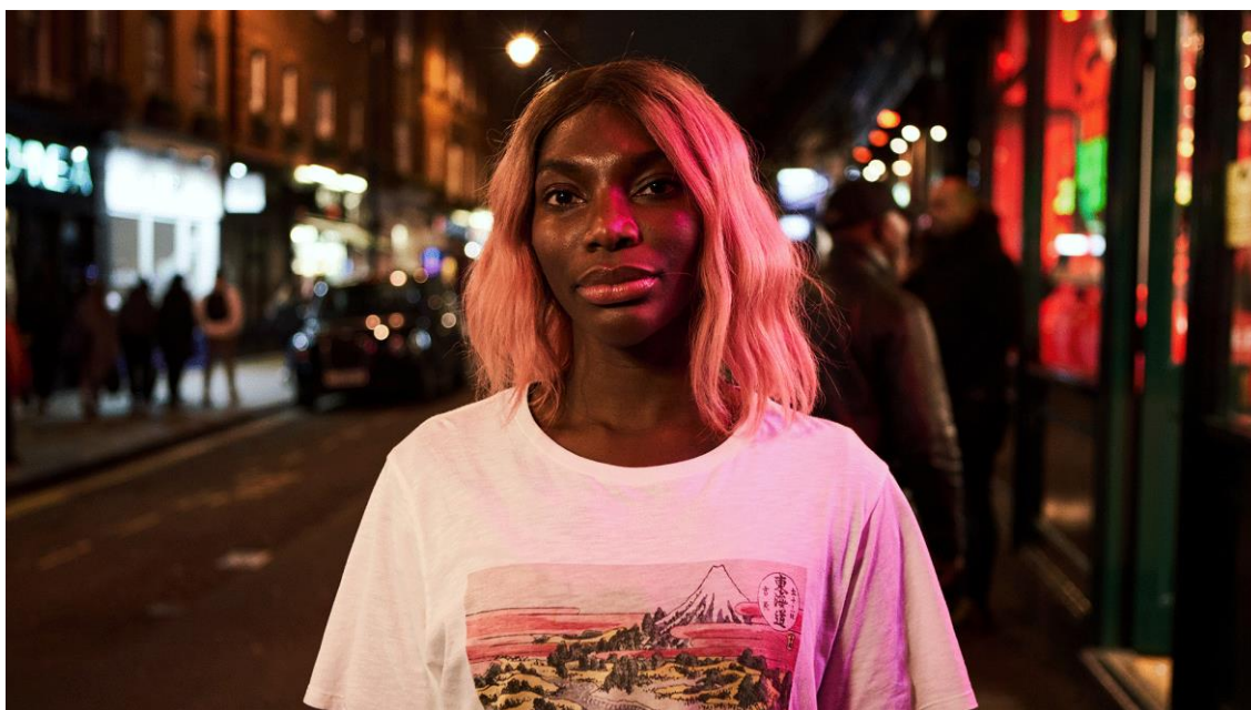
Michaela Coel, I may destroy you