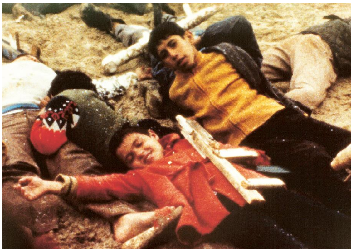
Jocelyne Saab, Les enfants de la guerre , Liban, 1976