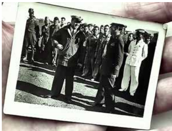
Pays barbare [2013]

Organisé par l'École des hautes études en sciences sociales et le Centre Pompidou, en partenariat avec La Fémis