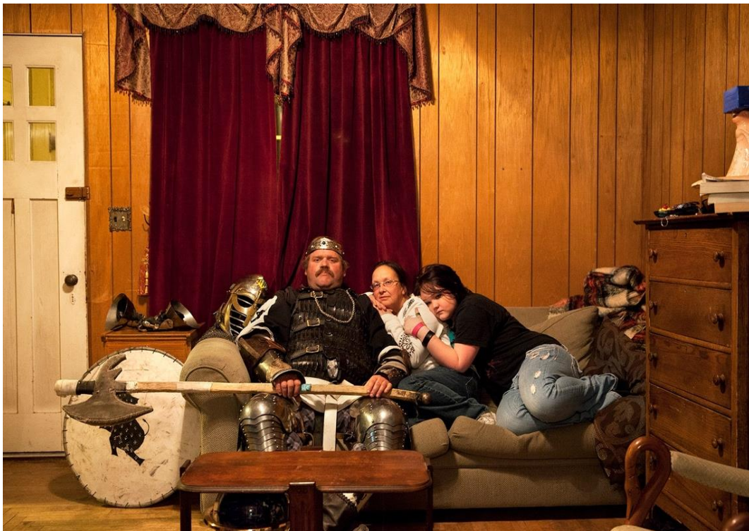
Bieke e Depo orter

Quelle promesse d'histoire cachent-elles ?